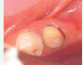
Pronto per l'impronta