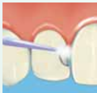
Applicare 20 sec