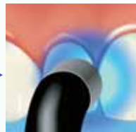
Fotopolimerizzare 5 sec Con lampada alogena